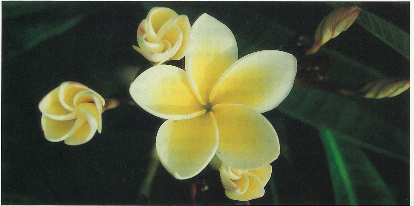
黃花緬梔花冠特寫