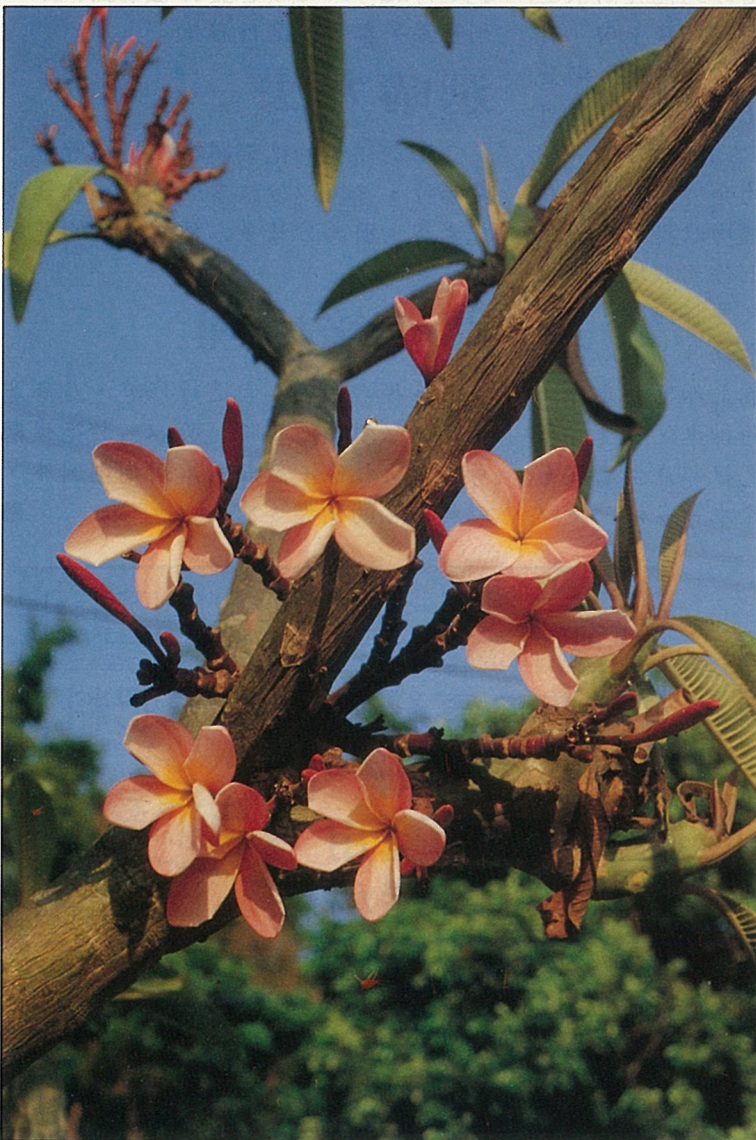
橙紅色的緬梔，本省栽培較少。