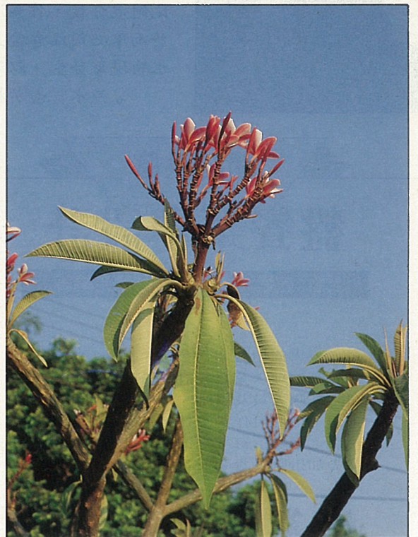
緬梔花頂生，是初夏開花最明媚的樹木之一。