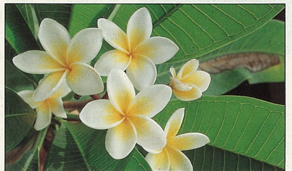
緬梔花具芳香，可供作香料。