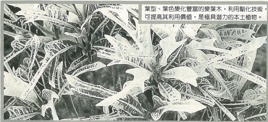
葉型、葉色變化豐富的變葉木，利用馴化技術，可提高其利用價值，是極具潛力的本土植物。