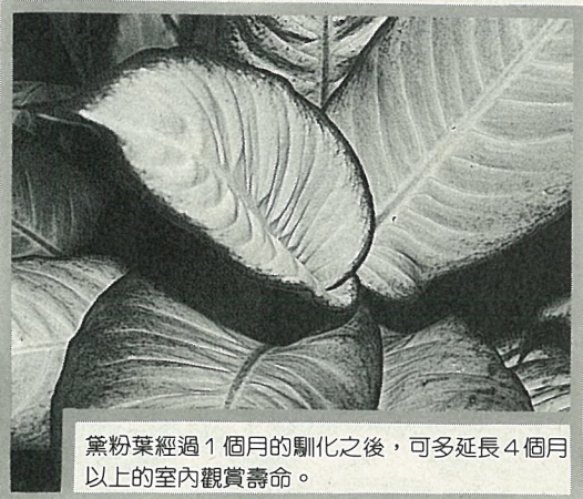
黛粉葉經過1個月的馴化之後，可多延長4個月以上的室內觀賞壽命。

，垂榕在全量光照下培養成林之後，逐漸加強遮蔭程度，例如由30%、50%、提高至80%；約5個星期左右，即可提高垂榕在室內的耐陰性，延長觀賞壽命。光馴化所需的時間長短依作物種類不同，而有不同程度的需求，如黃金葛只需3個禮拜即足夠，而觀音棕竹則長達半年的馴化期，一般植物皆只需5~8週即可算馴化完成了。