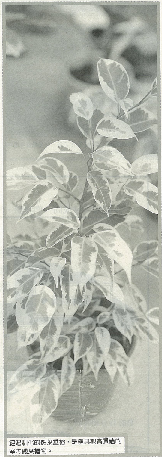
經過馴化的斑葉垂榕，是極具觀賞價值的室內觀葉植物。