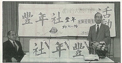
3月27日本社在農委會舉行公開抽獎