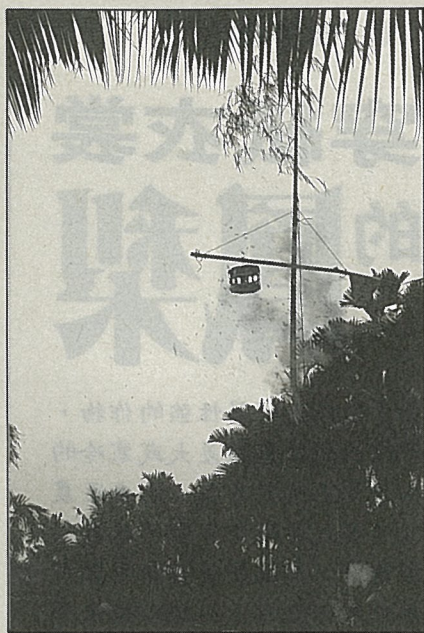
攻炮城是傳統民俗活動

由於場面壯觀，常讓圍觀者看得驚心動魄，不時要走避不長眼睛的炮屑，又要為炮城老攻不下，而急若星火。一旦炮城被炸爛，鞭炮點燃，炮屑上沖，頓時歡聲雷動，大鬆一口氣。■