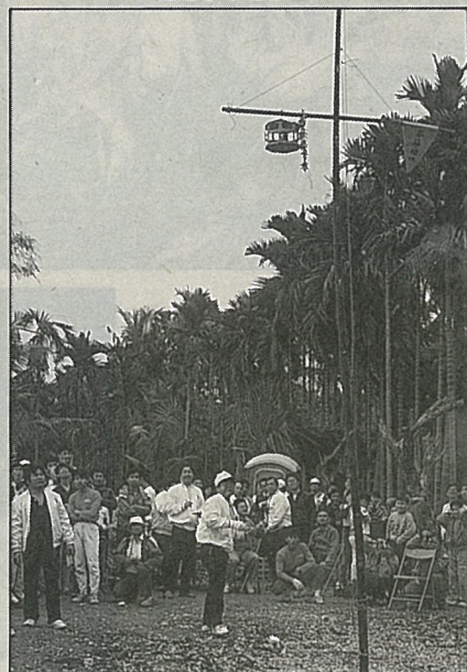
攻炮城的場面非常熱烈