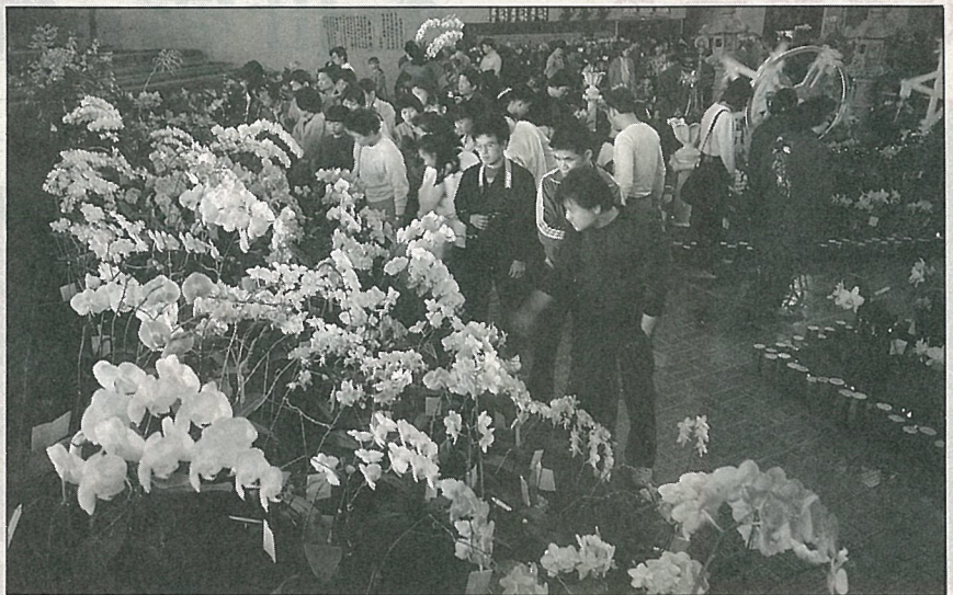
蘭花展吸引民衆前來參觀。

花卉展示在促進國民愛花、賞花、種花，進而用花卉陶冶情操，美化人生及提升生活品質，並以宣揚我國傳統民俗