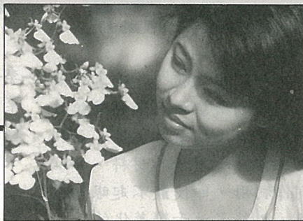
花卉可以提升生活品質

節慶為主題。走進縣府的中庭，花香撲鼻，在這兒展示的蘭花，嬌艷奪目，吸引不少民衆的眼光。