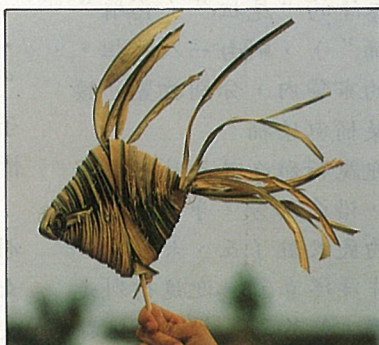
草編熟帶魚，唯妙唯肖。