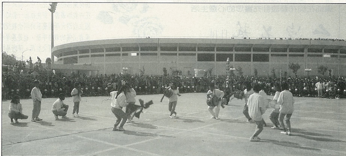
女子大鼓 特技表演