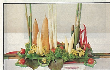
以蘆筍、胡蘿蔔、辣椒等做出的平行線設計