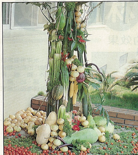
鮮美的蔬果，即點出農試所所舉辦的會議主題，也傳達田園之美的訊息，成功地做了一次感性的試驗成果展。