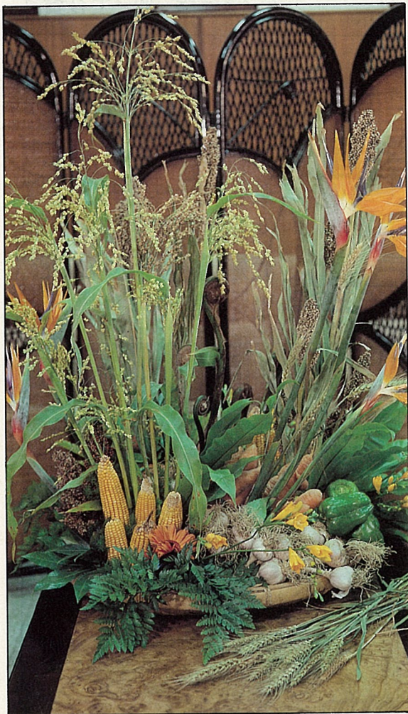
五穀雜糧德實飽滿，枝幹直挺，蔬菜水果色彩繽紛，互相搭配所插出來的作品，充滿豐收吉祥與鄉土之美。