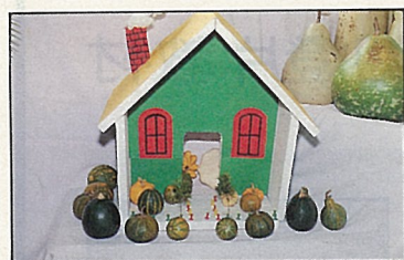
南瓜作擺飾，有趣又耐久。