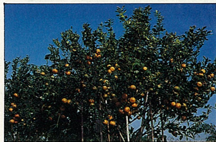
結實纍纍的柑桔樹，須經細心疏果。