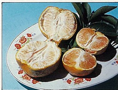
茂谷柑果肉桔紅(右)，甜度很高。

剛引入台灣時，種在福德坑垃圾場附近及翡翠水庫邊，後來漸被少數農民栽植，面積不到100公頃。