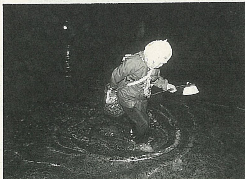
夜間照海捕魚原是漁民增加收入的一項來源。