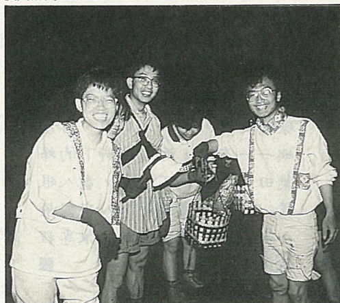
▲看，我捉到一隻章魚！