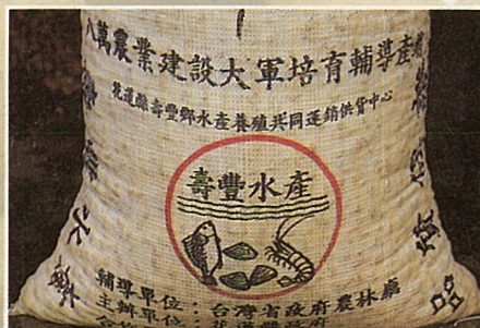
壽豐蜆有註冊商標

壽豐鄉的養殖戶有個特色，即大都為外地人，尤其以雲林、高屏地區前來拓殖者最多。由於壽豐養殖專業區全區的地質為礫石地，地下水豐沛，且水質清澈，含氧度高，養規效果良好。目前花蓮全縣之蜆80%均出自壽豐鄉。