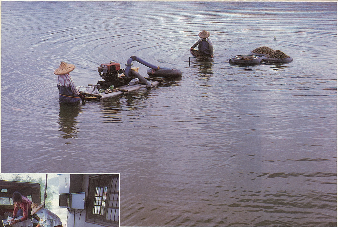
壽豐地區的地下水源豐富