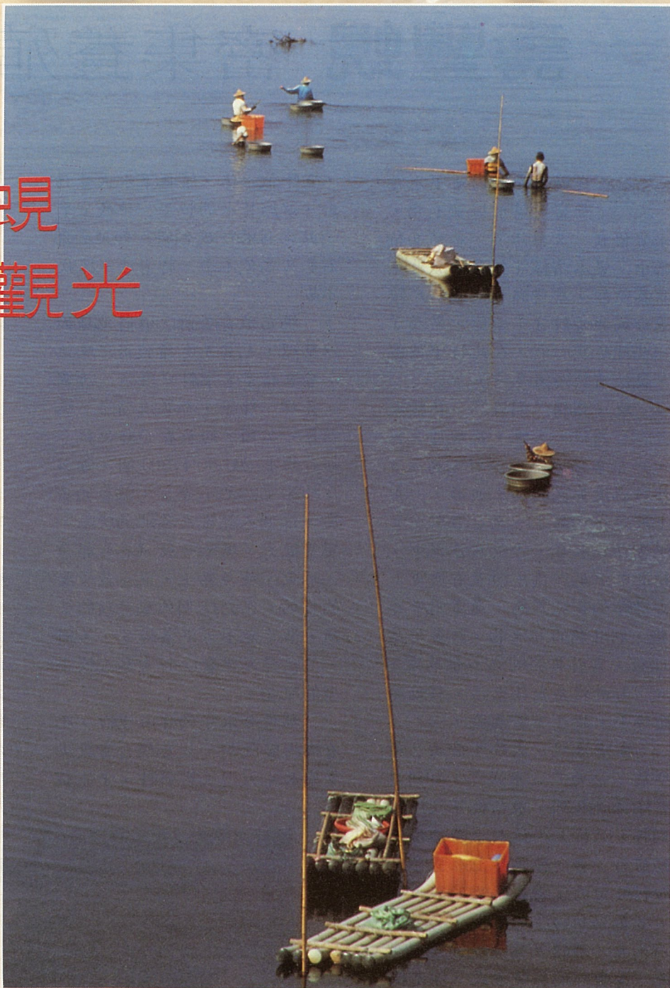
專業養蜆有發展觀光的潛力

、高雄等地，有關單位如能加強輔導，打開更寬廣的市場，尤其能在設備或公共設施上，加以補助協助，相信以壽豐的優良水質，能使此地的養殖業更為興盛。在豬價不穩，淡水魚又因國民生活水準提高，而較不受歡迎的情形下，如能有計劃發展養蜆的計劃，頗具前途，且可考慮以觀光養殖專業區的方式進行。