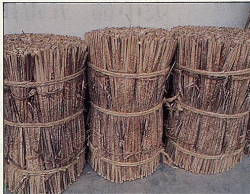
捆紮好的桂竹筴，等待商人收購。