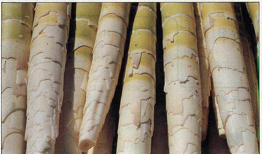
桂竹筴是美味佳餚