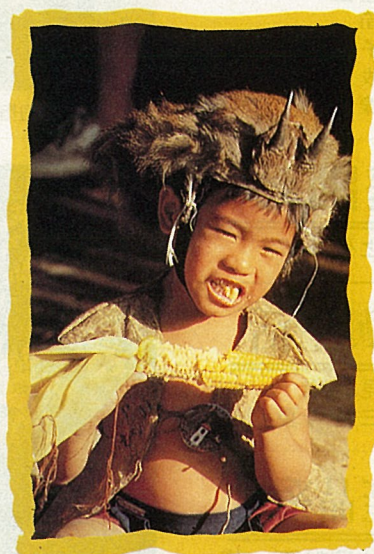
布農族的勇士、婦女、男孩。

高 雄縣三民鄉東鄰桃源鄉，西接嘉義縣阿里山鄉及大埔鄉，南至高雄縣甲仙鄉及台南縣南化鄉，北至桃源鄉西北部止，總面積 252.98 平方公里。