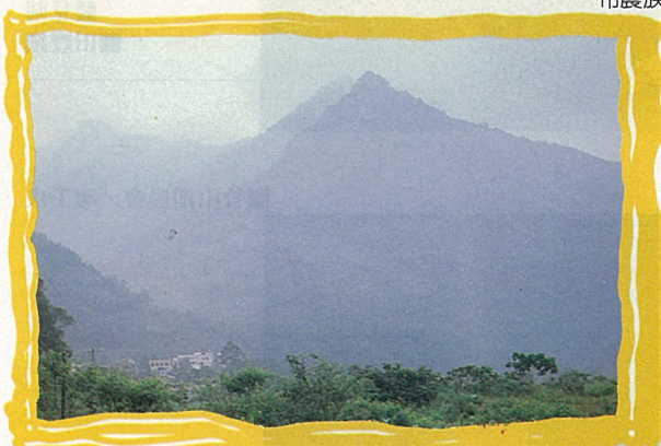
藤苞山——三民鄉人的聖山

台灣光復後，政府依地理環境、民俗風情、天然形成，劃分 3 個村行政區域，即民族、民權、五權村，並將瑪雅鄉於民國 46 年時，奉令更名為三民鄉，五權村改為民生村，定名為高雄縣三民鄉，下設民族、民權、民生三村。目前鄉境內的山胞，分 4 種族系，曹族為原始，隨後布農族、排灣族、泰雅族相繼遷入，而以布農族人數最多，約佔全鄉人口的 \frac{2}{3} 。