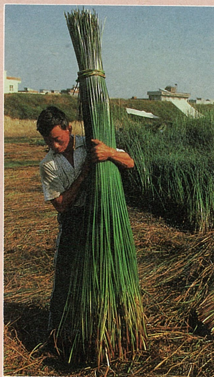
三角藺身價，愈長愈高。