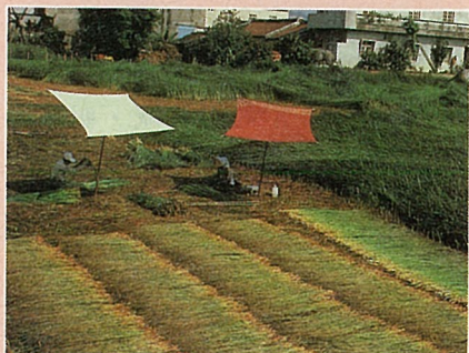
草莖就地攤放在草田中曬乾