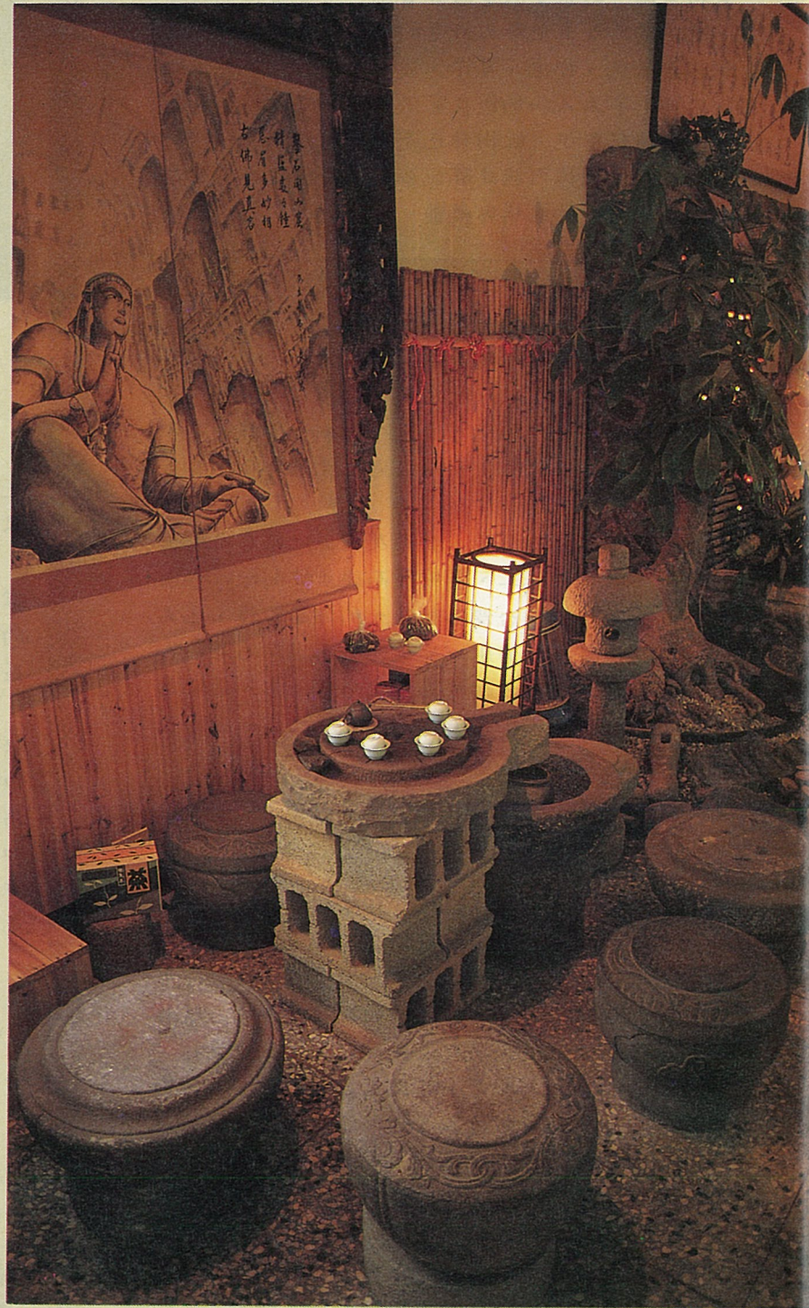
石磨當桌，石珠當椅。

“水龍吟”茶舍能收集如此完整的一組古物，並且巧妙地把原本完全不同性質的物品，組合成一套頗具古思的茶具，也算是為古物賦予新生，雖然價值不貲，但是，這一份化古物於新用的構想，則頗令人激賞。