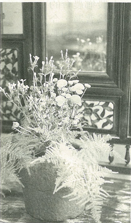
小石白當作花器，舊瓶裝新酒，只要搭配巧妙，常有意想不到的效果。請看22頁。