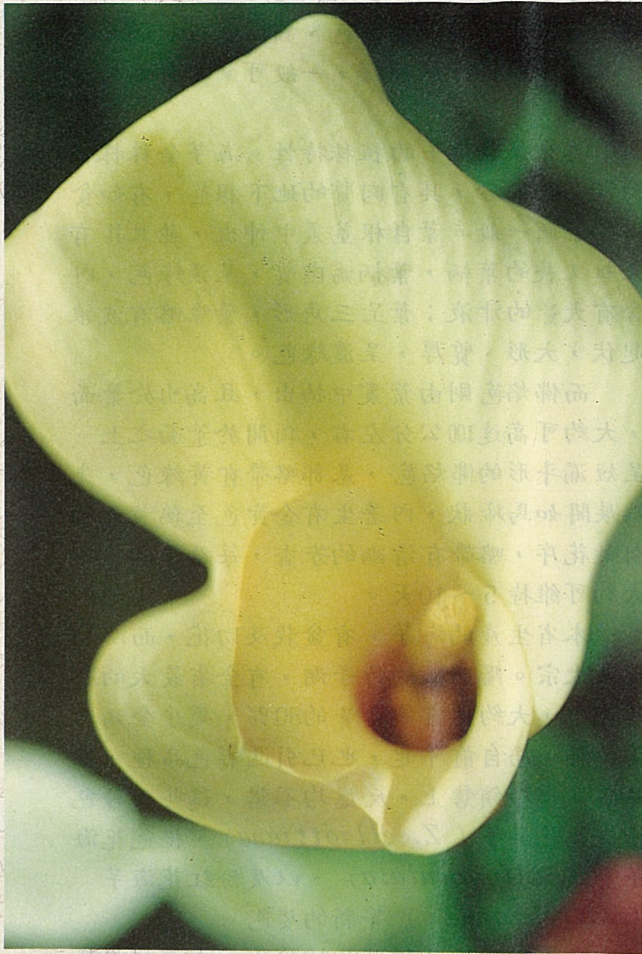
真正的花是佛焰苞中央的鵝黃色柱狀物。