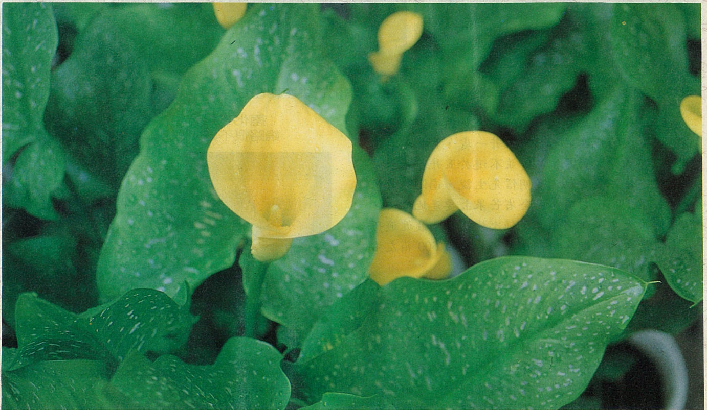
鮮黃海芋何其出色！