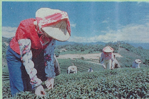
極風茶是以手採茶芽調製而成