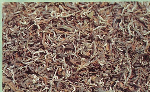
茶心白毫很多是極風茶的特色

洲英、法、德國，喝“東方美人”的均為上流階層的人士，可見身價之非凡！一般茶葉一年四季均可生產，唯獨極風茶一年中只能在第一次夏茶期間生產，產量少且品質特異，售價高昂亦有其理由存在。極風茶除了在明德水庫一帶生產外，頭份鎮以及新竹縣北埔、峨眉鄉亦是盛產地。 ■