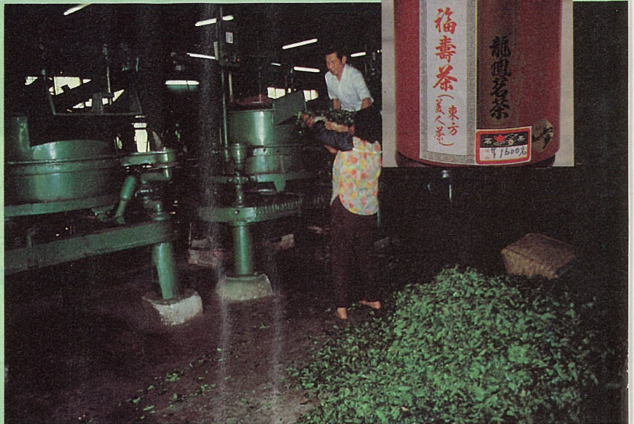
苗栗縣明德水庫附近一家極風茶製茶廠

極風茶的名稱很多，英國人以其外觀漂亮，而譽之為“東方美人”。洋人喝此茶時，喜放一、二滴香檳酒，以增加香味，故又稱為“香檳烏龍”。在歐