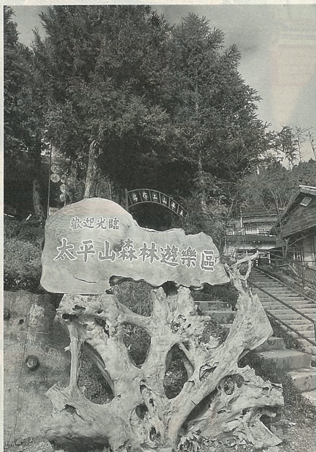
太平山森林遊樂區

省政府從78年度開始，以5億3千萬元的經費，分4年將太平山的道路交通確實改善，以提升太平山森林遊樂區的遊憩安全和品質，因此，蹦蹦車以及索道均將廢除，僅保留太平山至獨立山野生動物保留區的蹦蹦車，以及白嶺、獨立山的索道頭（流籠頭）。