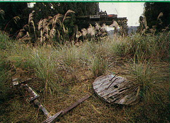
漸被荒草掩沒的索道