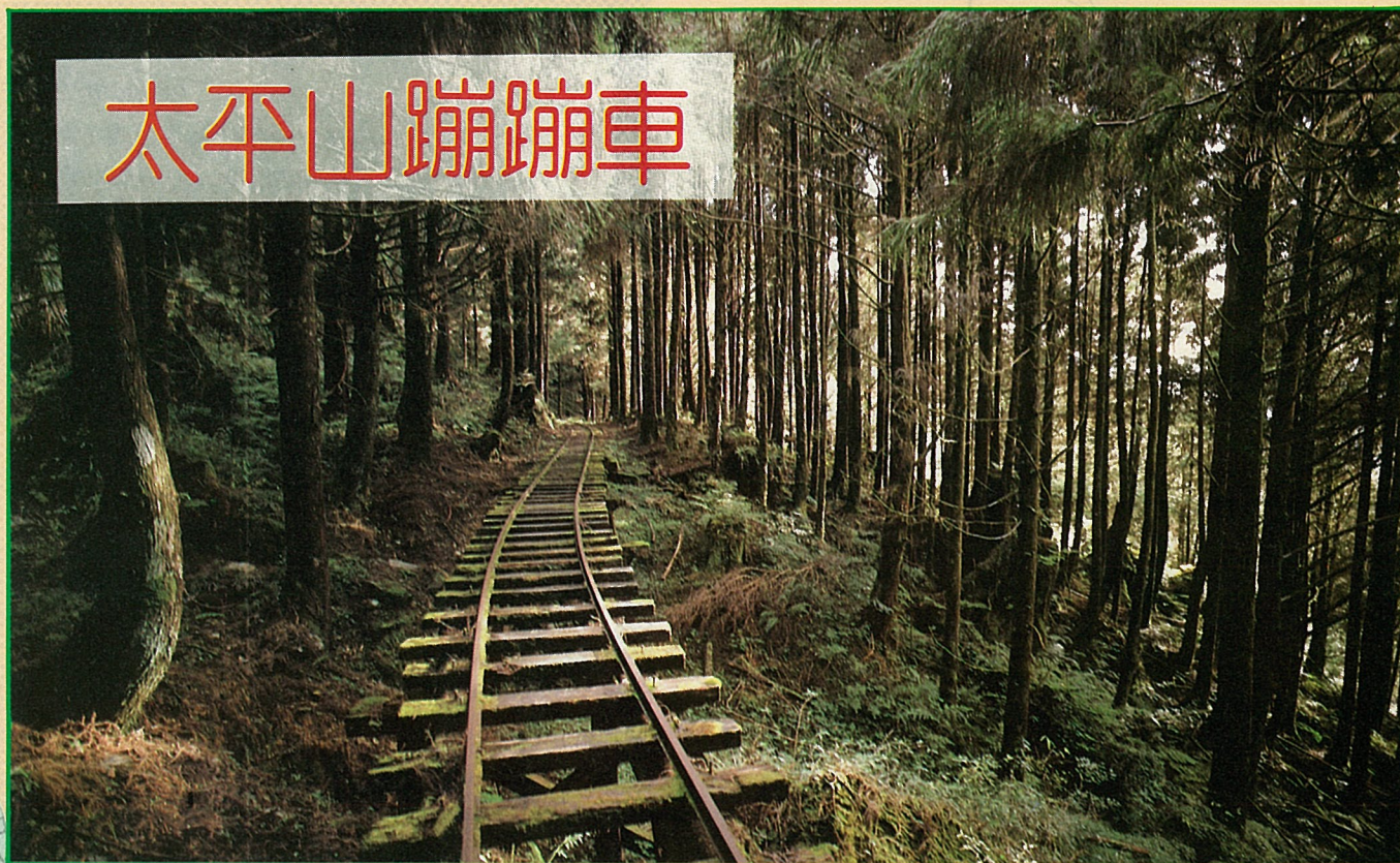
蹦蹦車一路穿過幽密的原始森林