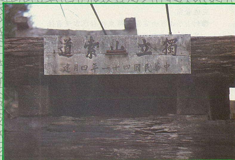
建於民國41年的獨立山索道