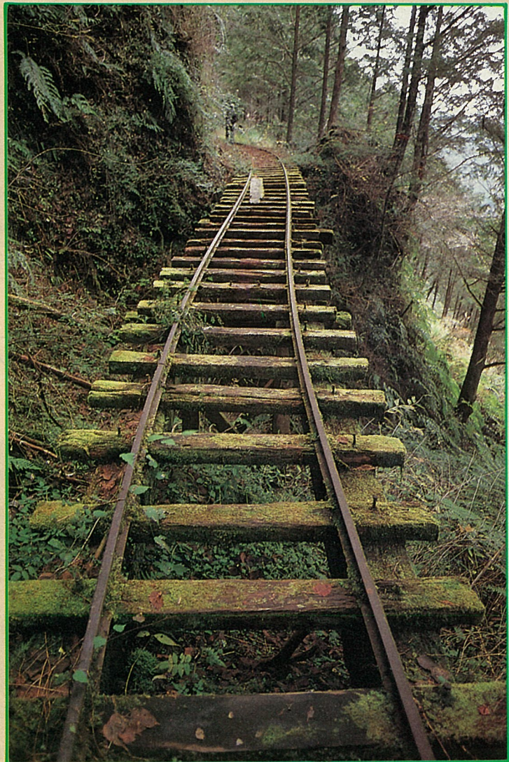
蹦蹦車鐵道是太平山最大特色