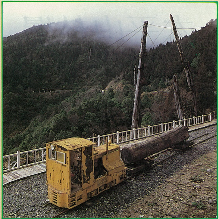
這就是運材蹦蹦車