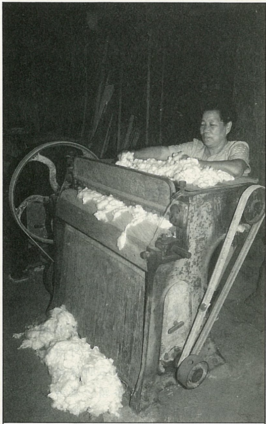
軋棉機分離棉子與棉絮