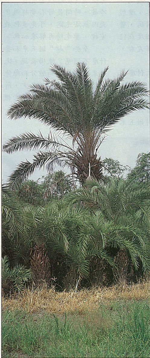
糠榔是理想綠籬植物

“糠榔”是屬“海棗屬”的樹，樹型和鐵樹很相似，也是棕櫚的一種，由於她有咖啡色鱗片狀的樹幹，濃綠色的羽狀葉片，所以種在庭院或大草原裡非常好看，有浪漫的南國風情，本省東南部淺山坡裡常可見到她的情影，據說20幾年前東海岸公路邊都可瞧見糠榔迎風搖曳的風姿，近年已少見了。