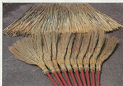
取代糠榔的另一種貴黍帚

“糠榔”樹的葉子在早期農村裡是做掃把的好材料，那時農家裡屋角裡或倉庫邊少不了要擺幾隻糠榔掃把，因為糠榔掃把質地柔軟且耐濕不易腐爛，是用來掃地板、掃晒場上五穀、清蜘蛛網的好幫手，尤其用在清理水溝更理想，因而有人戲稱她是“掃黑”高手，這種掃把現在已不多見了，尤其30歲以下的年輕人可能從未看過，甚至不曉得有這回事。