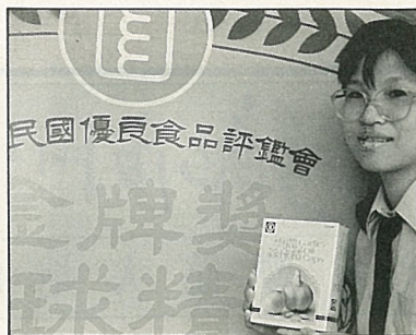
金牌獎蒜球精每盒120粒 售價1500元