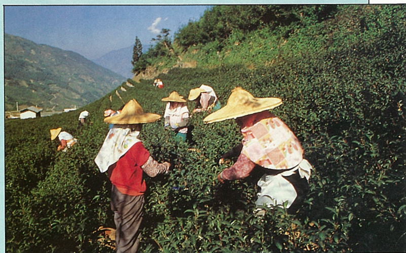
生長在高海拔的玉山烏龍茶