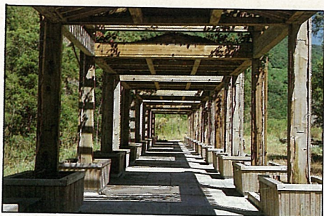
野餐烤肉區美麗的花棚