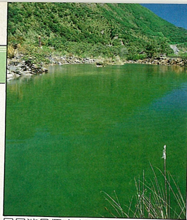
日月池是個冷泉游泳池