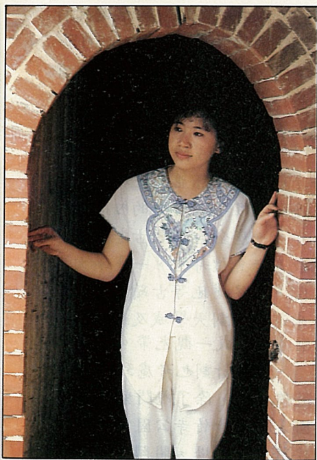
夜宿農家，體驗農村生活。