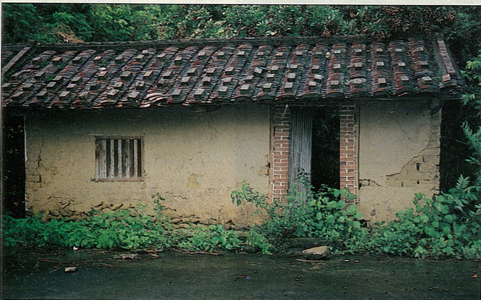
內門鄉計畫保存古農舍，提供民宿。

內門鄉位於高雄縣之東北部，東界杉林鄉，西與台南縣龍崎鄉毗鄰，南鄰旗山鎮，北與台南縣南化鄉、左鎮鄉為界。四週山巒環繞，形如盆地，楠濃山貫穿鄉境中部，致分割為東西兩部，境內高低起伏很大，地勢從北端逐漸向南傾斜，區內多山，平地較少，地勢陡峭，可耕地不及2,000公頃，農作物除水稻外，以栽培龍眼、芒果、荔枝、香蕉等果樹為主。