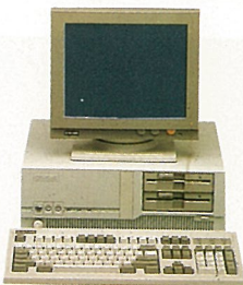
T-88MB ● 1.2MB FDD x 2 ● 14"單色顯示器