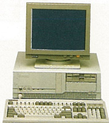
T-88MW ● 1.2MB FDD x 1 ● 40MB HDD x 1 ● 14"單色顯示器