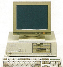
T-59MB ● 1.2MB FDD x 2 ● 14"單色顯示器