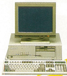
T-59MW ● 1.2MB FDD x 1 ● 40MB HDD x 1 ● 14"單色顯示器