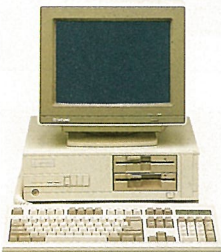
T-59VB ● 1.2MB FDD x 2 ● 14"VGA彩色顯示器