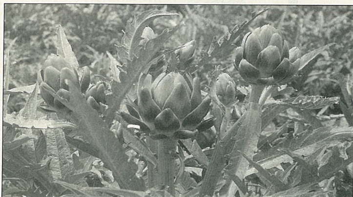
朝鮮薊供食用及加工部位—花蕾

朝鮮薊在國外均以宿根栽培，利用其分株芽每3~4年行更新一次，以無性繁殖法延續後代；而本省栽培朝鮮薊是以進口種子栽培，其後代容易產生劣變，有株高及抽苔開花整齊度不一，球花產量不穩定等缺點產生。且朝鮮薊從種子播種、定植到抽苔、開花而採收，需時170天左右，生育期間長跨秋冬春三季，而僅採收一期即予砍除廢耕，改種其他短期作物。如此對時間及農地利用很不經濟。