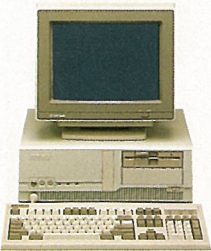
T-88VW ● 1.2MB FDD x 1 ● 40MB HDD x 1 ● 14"VGA彩色顯示器