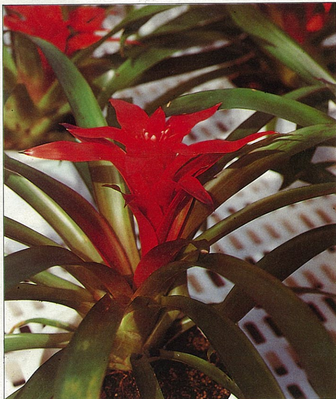
觀賞鳳梨是冬季熱門盆花