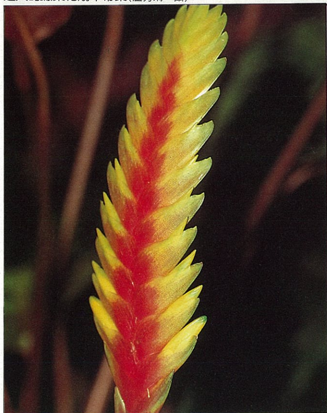
這一種鳳梨花，像不像假花？