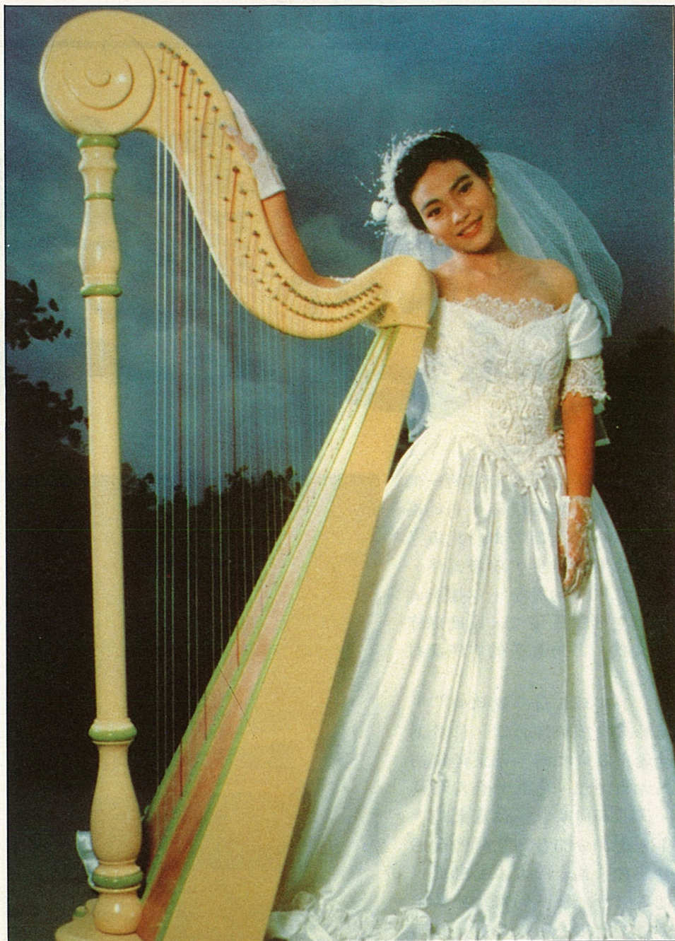
豎琴與箏篥造型相像

。其特有的顫音效果，如泣如訴，纏綿動人，如在訴說美麗的情懷，加上高貴優雅的外型，不但兼具剛柔並濟之視覺美，表現高度的文化氣質，締造至美之音感。在內蘊的藝音和外在的風貌，相互輝映之下，深信箏篥必能帶給國內樂壇不同凡響之風格！