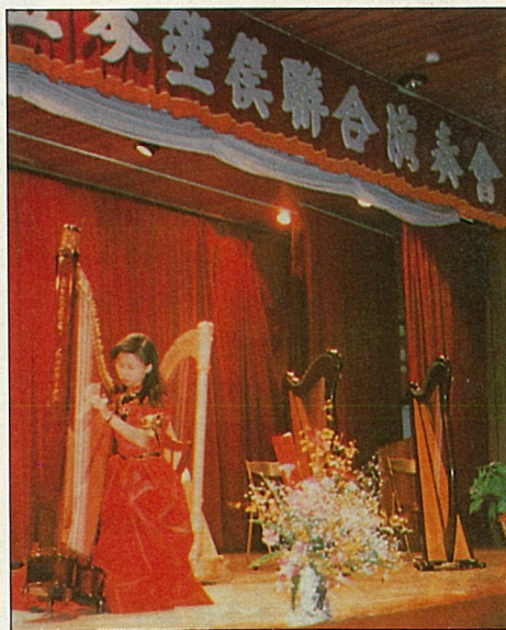
箏篥豎琴聯合演奏會