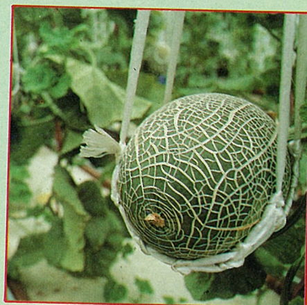
(左)水耕花卉(右)水耕洋香瓜