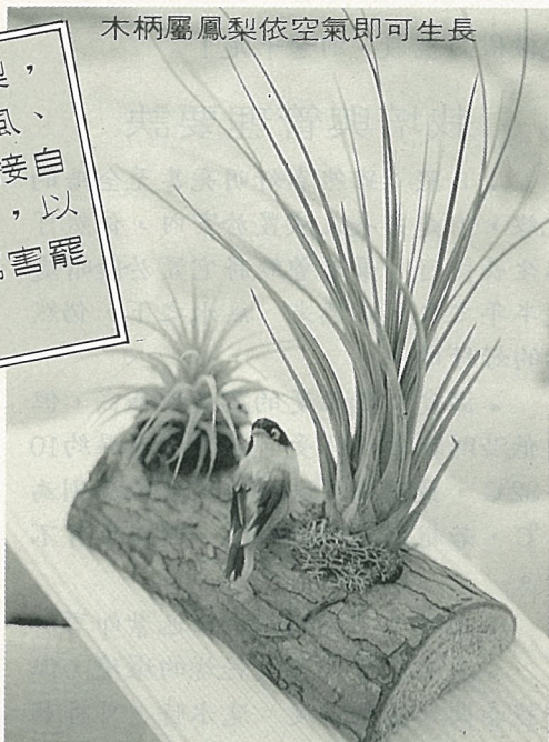
木柄屬鳳梨依空氣即可生長

有鱗片的鳳梨，可長期抗旱、抗風、抗酷暑，並可直接自空氣中吸收養分，以維持生命，夠厲害罷！