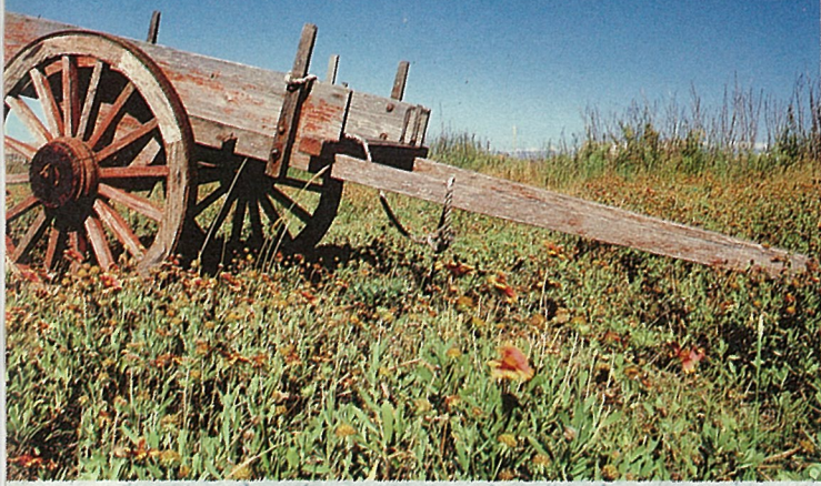
原野是天人菊最鍾愛的地方