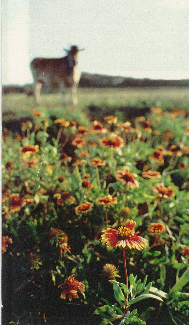
原野是天人菊最鍾愛的地方