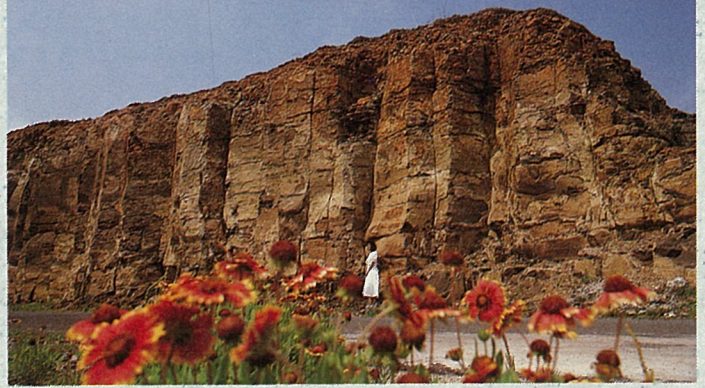
海港邊也有天人菊的芳踪