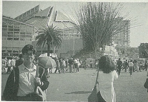
日本最大的溫室外觀

一進入溫室，從濕原地帶生長的睡蓮、榕樹到寒帶花卉都可見到，走在展示館中便猶如從熱帶旅行到極地的“花之旅”一般。