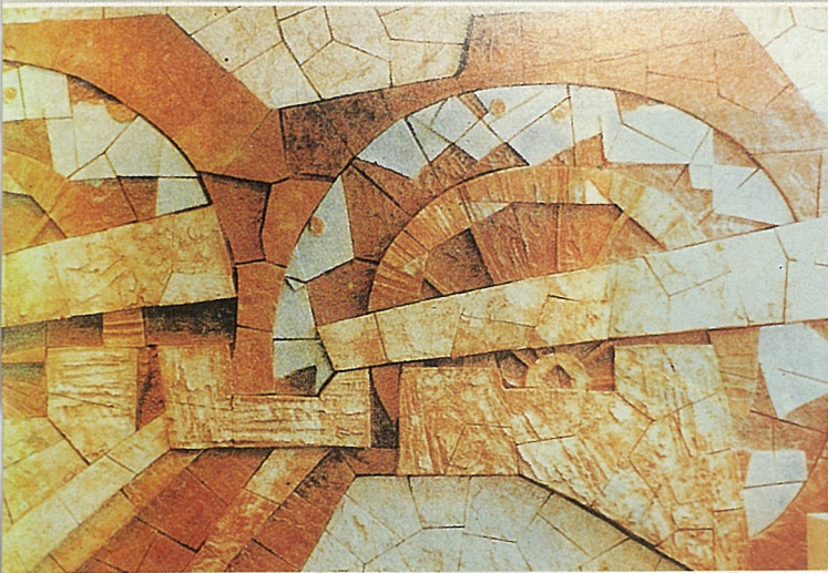
藝術陶壁(省立美術館)