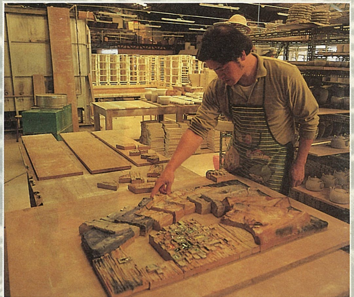
藝術陶壁縮小燒製實驗