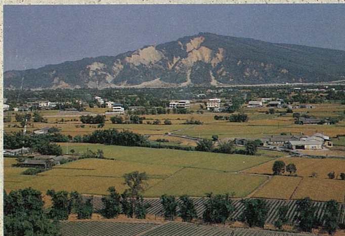
火炎山屹立於后里盆地