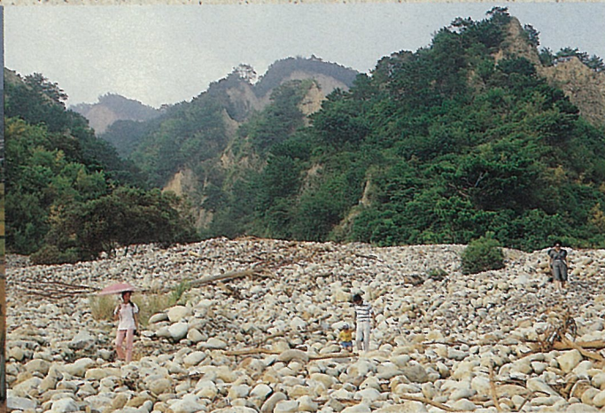
火炎山下滿佈砂石

滑到大安溪內，目前，火炎山下就有一家混凝土拌合場，經年累月的利用火炎山滑下的砂石，來拌合混凝土。