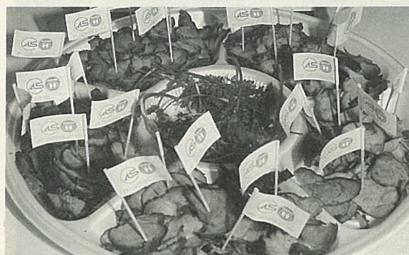
優良肉品品質保證

但是豬肉却是動物肉中比較特別的，它的脂肪含量在不同的部位差異最大，100公克肩部蛋白質17.5公克，脂質15.1公克；臀部蛋白質20.4公克，脂質7.4公克；大里肌有蛋白質16.5公克，脂質25.7公克。而小里肌