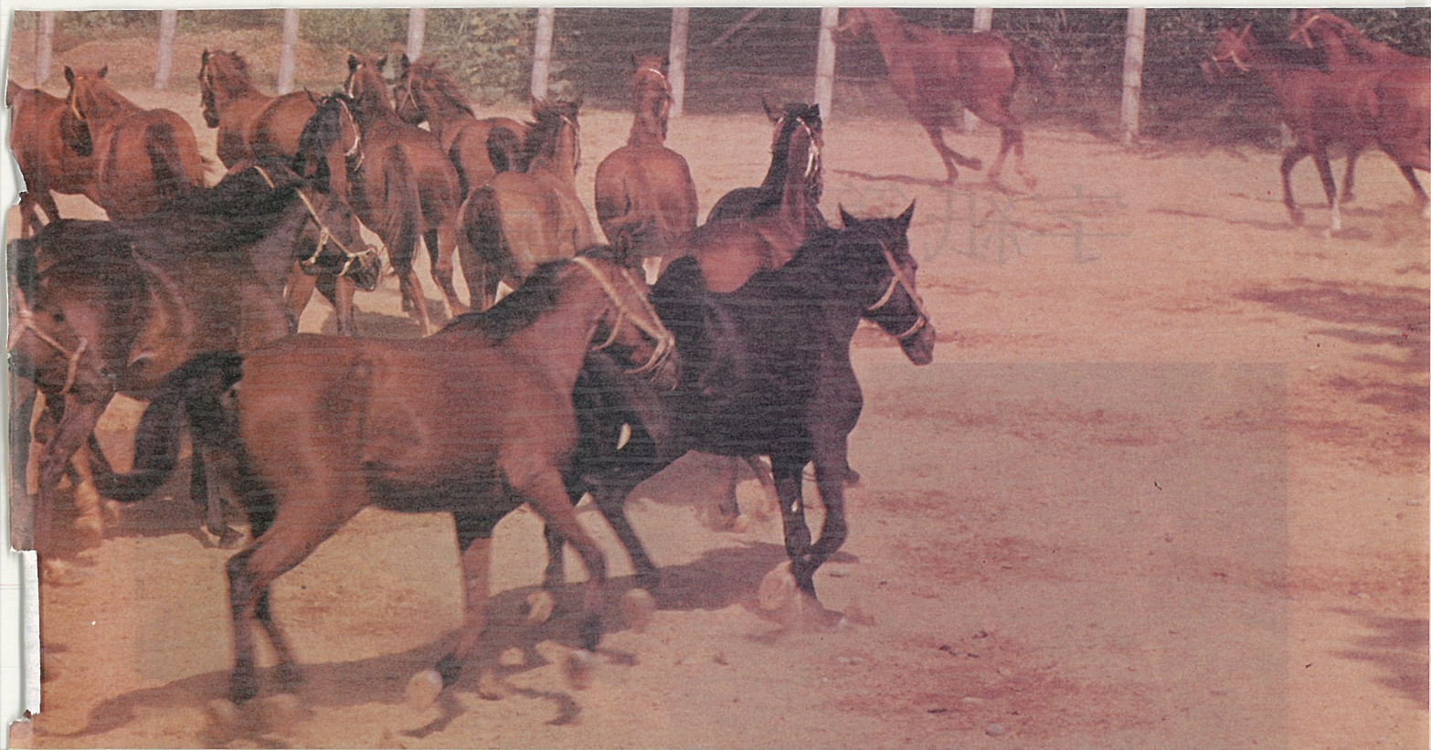
後會有期