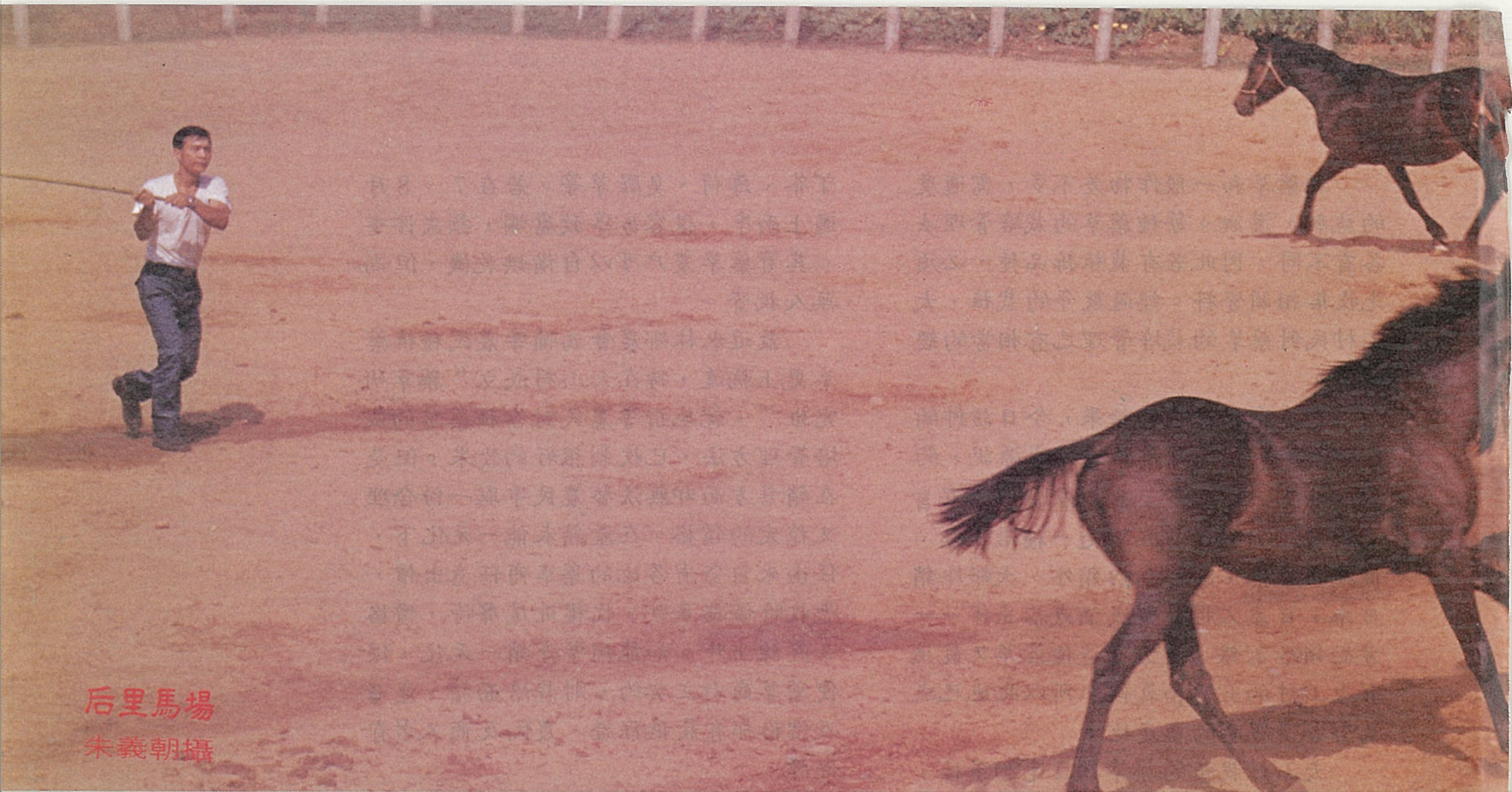
后里馬場