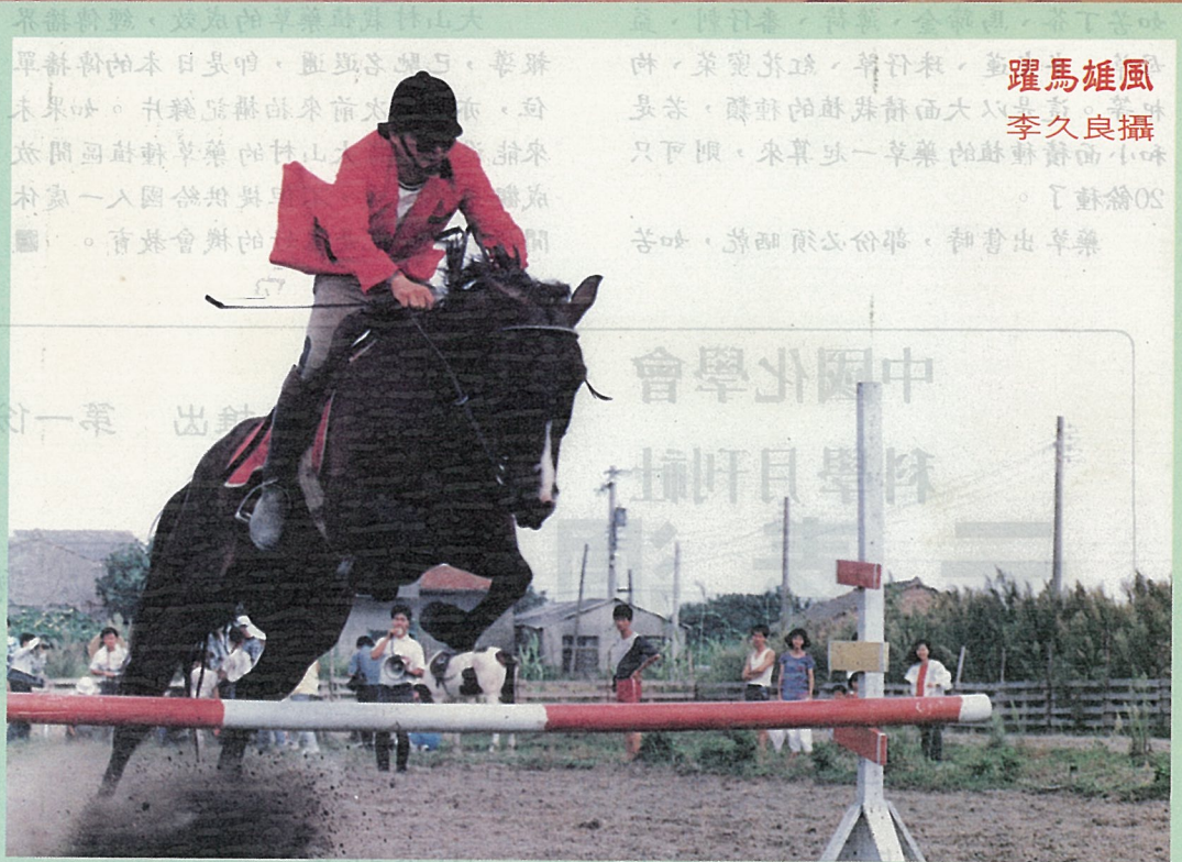
躍馬雄風