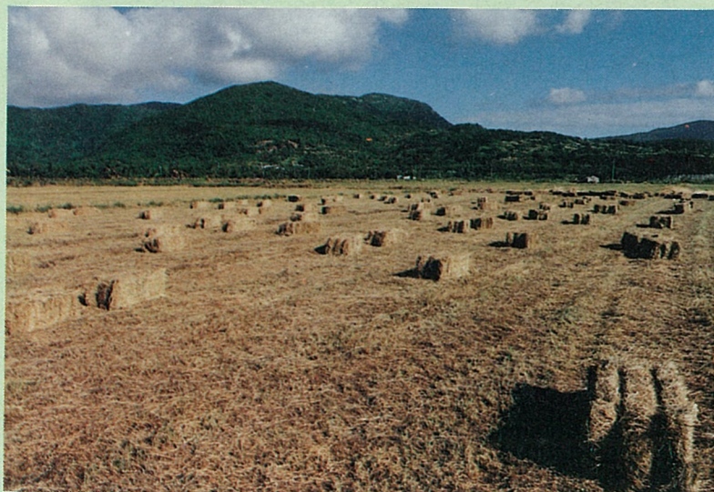
滿州牧草一年三收