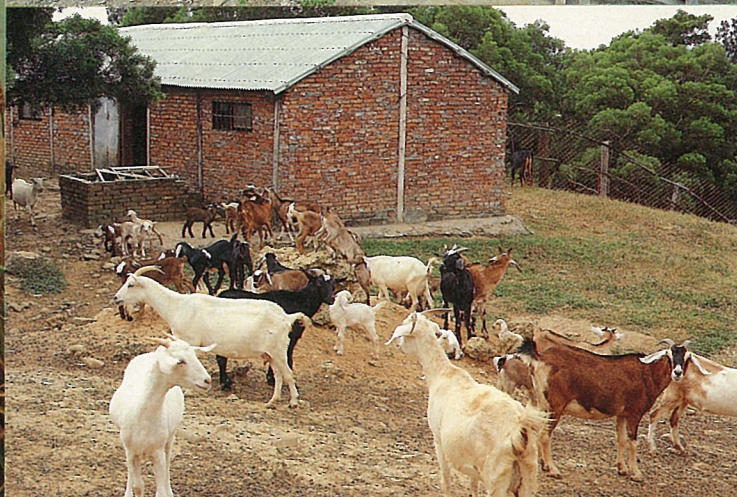
荒蕪山地開闢成養羊專業區