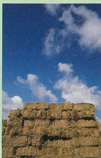
目前正值牧草收割期