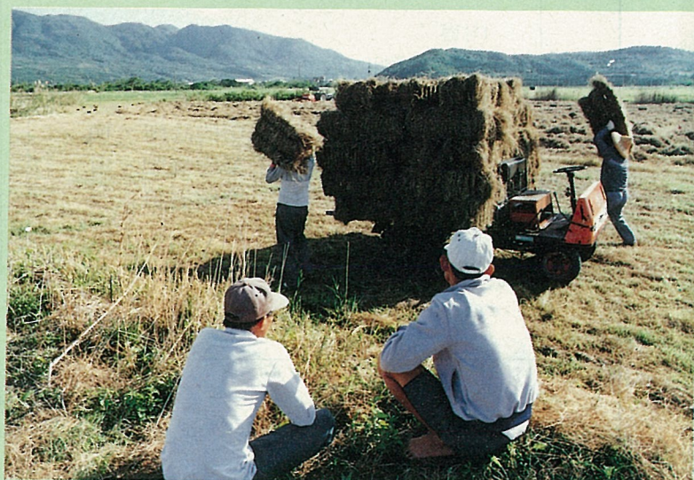
種牧草的收益還不錯