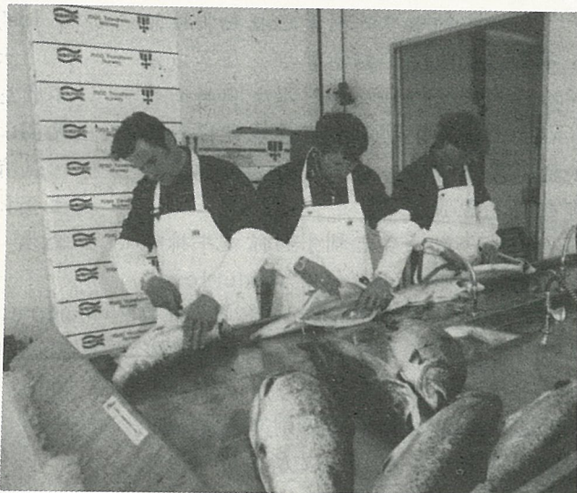
取內臟的工作必須小心翼翼，不可損及魚體，此櫃枱只允許鮭魚在此清洗。

最 近這些日子來，中美兩國之間，為了一個在北太平洋捕撈鮭魚的問題，鬧得風風雨雨。美國國務院和部分國會議員，一再指責台灣漁民非法撈取鮭魚，甚至會損害到兩國之間友好關係的發展。