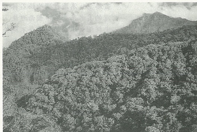
台灣穗花杉自然保留區

穗花杉科植物是中國的特產植物，台灣產一種“台灣穗花杉”，分佈於台灣南部中央山脈姑子崙山、大漢山及里龍山，垂直分佈於海拔700至1300公尺山區。台灣穗花杉性喜溫暖濕潤環境，多分佈於背風之坡面及谷地中，據調查，目前台灣穗花杉年屆開花結果之壯年木或老年木，總數不過數十棵而已，可謂瀕臨絕跡。 ■