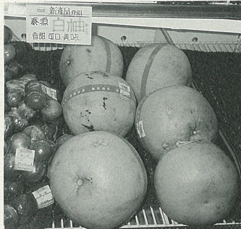
泰源大白柚在台東縣農會生鮮超市中販賣

台東區農業改良場和東河鄉農會都很關心柚果的產銷問題，目前委託青年公司在台北地區作30~40個據點促銷的方式固然很好，但是如能把銷售網擴及