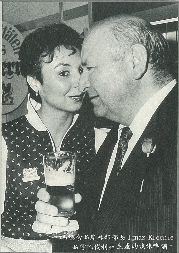
西德食品農林部部長 Ignaz Kiechle 品嚐巴伐利亞生產的淡味啤酒。

根據上表分析：從此項 811 位男子篩檢的結果可以看出，你與攝護腺癌症打交道的機率，隨着年齡而穩定的上升。