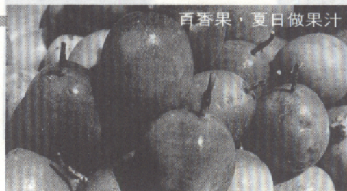
百香果，夏日做果汁

內湖區種植百香果的農戶約有10家之多，經營觀光果園的農戶也有2~3家。可是，今年因遭遇上述情形，只有一家開放。