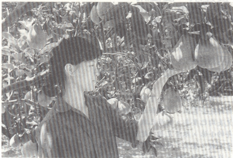
中秋一到又有文旦柚可吃了

原 來在台灣西部才有的文旦柚，近年在東台灣也生了根，花蓮全縣文旦柚的種植面積已達1100公頃左右，其中以瑞穗鄉500公頃最多，其