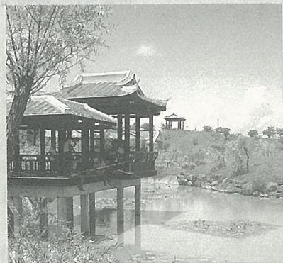
封面·園林之美