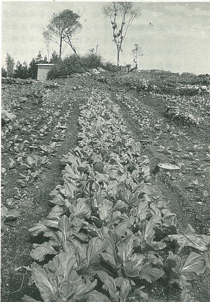
大瀟地區的高冷地觀光蔬菜專業區