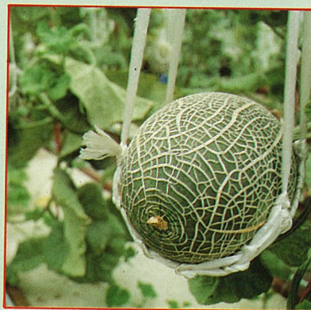
(左)水耕花卉(右)水耕洋香瓜