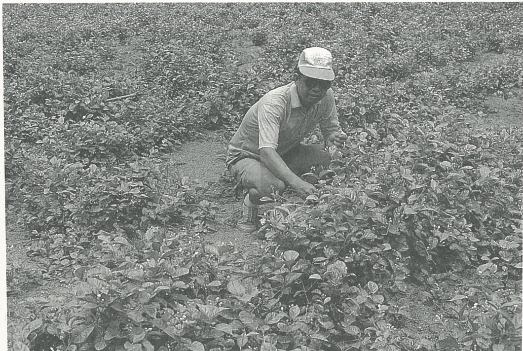
農人採茉莉花作為賦香原料。

小時候最愛做的一件事就是到花園裏摘滿滿的一手茉莉，捧在手中，將鼻子埋進去深深的、深深的吸滿一大口香味——那種很舒服的味道，然後將它們一個個很仔細的插在老曾祖母稀疏的髮髻上。她很喜歡茉莉花，也很喜歡我，總是很滿意我為她插出的“傑作”，她會拿著鏡子端詳許久，還會說我很乖，我想從那時候起我更喜歡茉莉了。