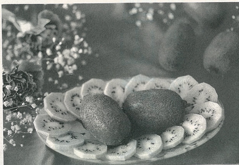
獼猴桃鮮果切盤

台東場選在海拔較高的地方試作，是因為台東地區有廣大的山坡地，而且獼猴桃貯藏力很強，普通採收後要數週才可食用（一般常溫貯藏需20~30日，