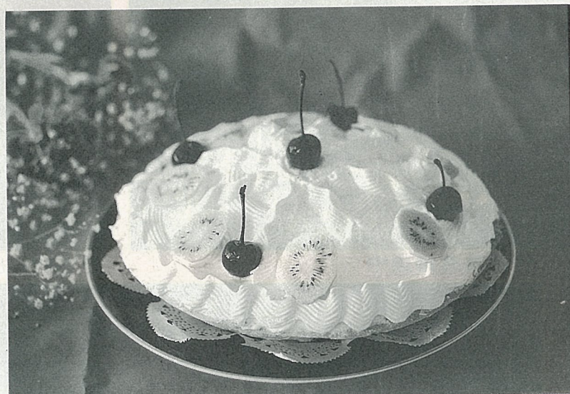
獼猴桃經常用為蛋糕上的裝飾品

如在冷涼且通風良好的地方不冷藏也可保存50~60天)，因此其特性對交通不便的山區非常適合。