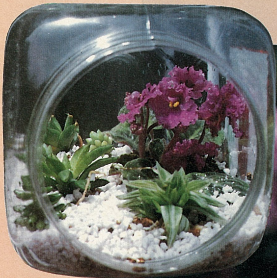
適合與小植物合種在透明花房裡。