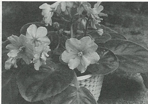
照顧得當的植物， 開花繁盛，葉片挺 直。

→ 部情形，加以修剪，並加添新介質。栽植後放在較陰暗處幾天，等花株恢復元氣後，始予灌水施肥。