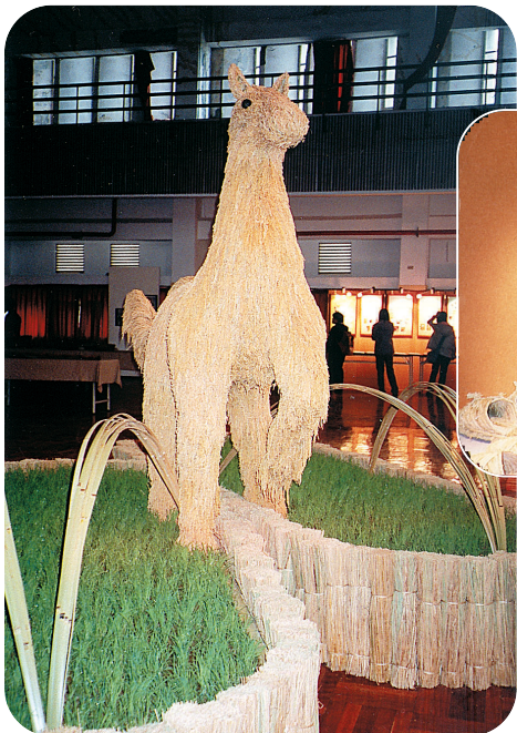
紀念馬年吉祥物草馬